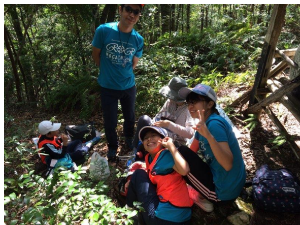
東屋で昼食タイム