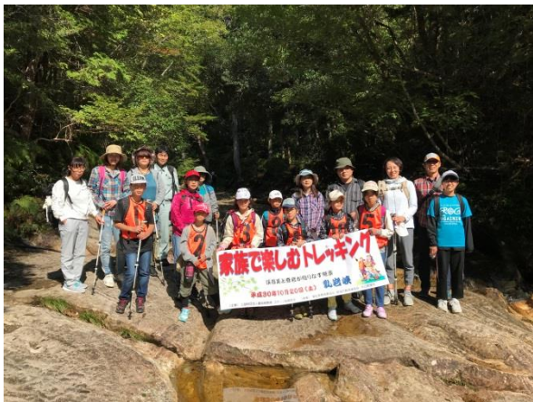
先発隊、集合写真を撮って出発です。