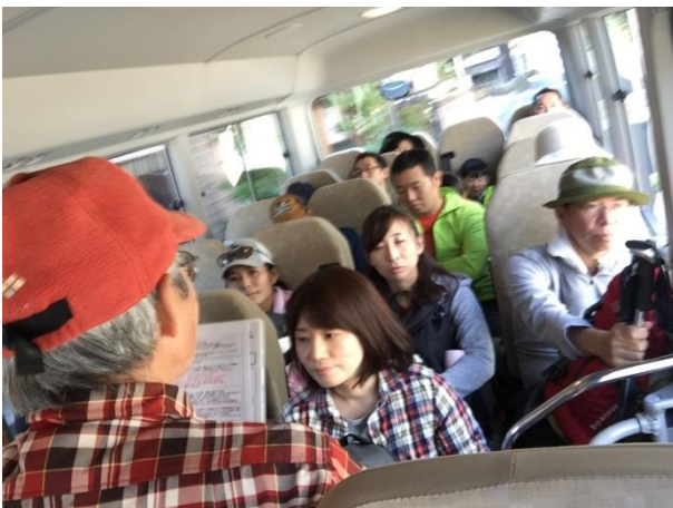
バスの中で『トレッキング入門講座』