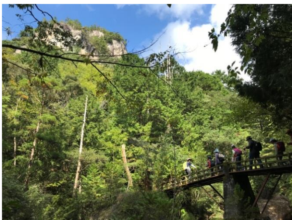
前方に見える岩山が乳岩ですよ。